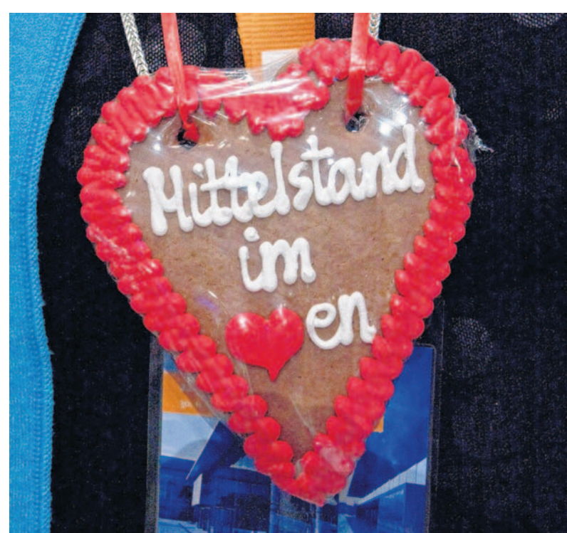
Der Mittelstand macht den Großteil deutscher Unternehmen aus.