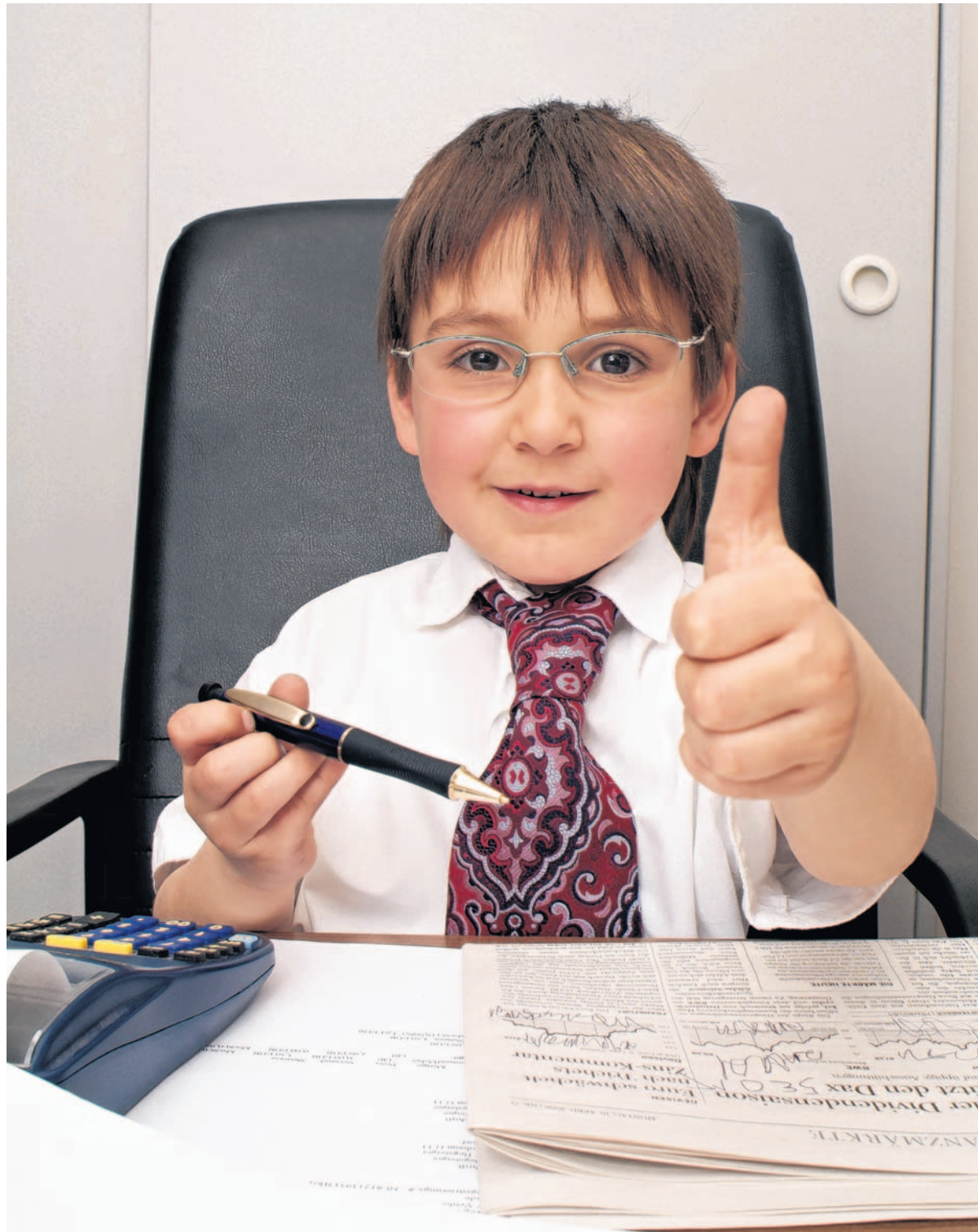
Jung-Unternehmer und alte Hasen wagen auch in Krisenzeiten den Sprung in die Selbstständigkeit.

Ein solcher Unternehmerrisiko scheint in der Metropolregion